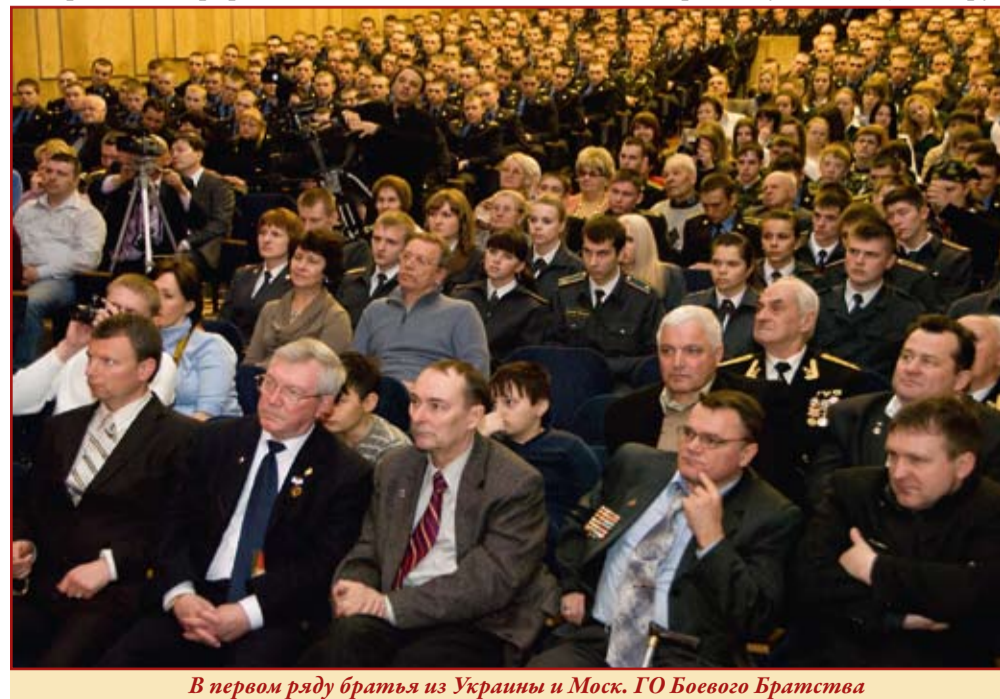
В первом ряду братья из Украины и Моск. ГО Боевого Братства