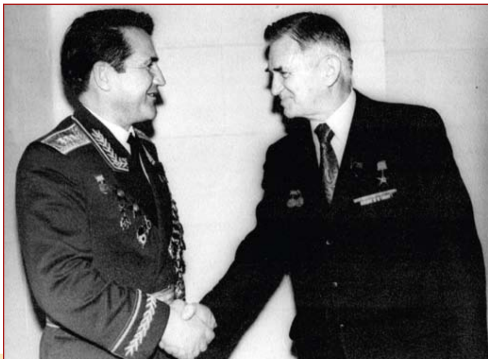
г.Киев. 1975 год. С Героем Социалистического труда - О.К.Антоновым, известным авиаконструктором. Под его руководством создан ряд самолетов, в т.ч. Ант-22 (Антей) грузоподъемностью 80 т (!).

Хотя полет на разведку выполняется на предельно малой высоте, нередко на уровне верхушек деревьев, все равно разведчика полностью не спрячешь от «глаз» противника, его сразу узнают по