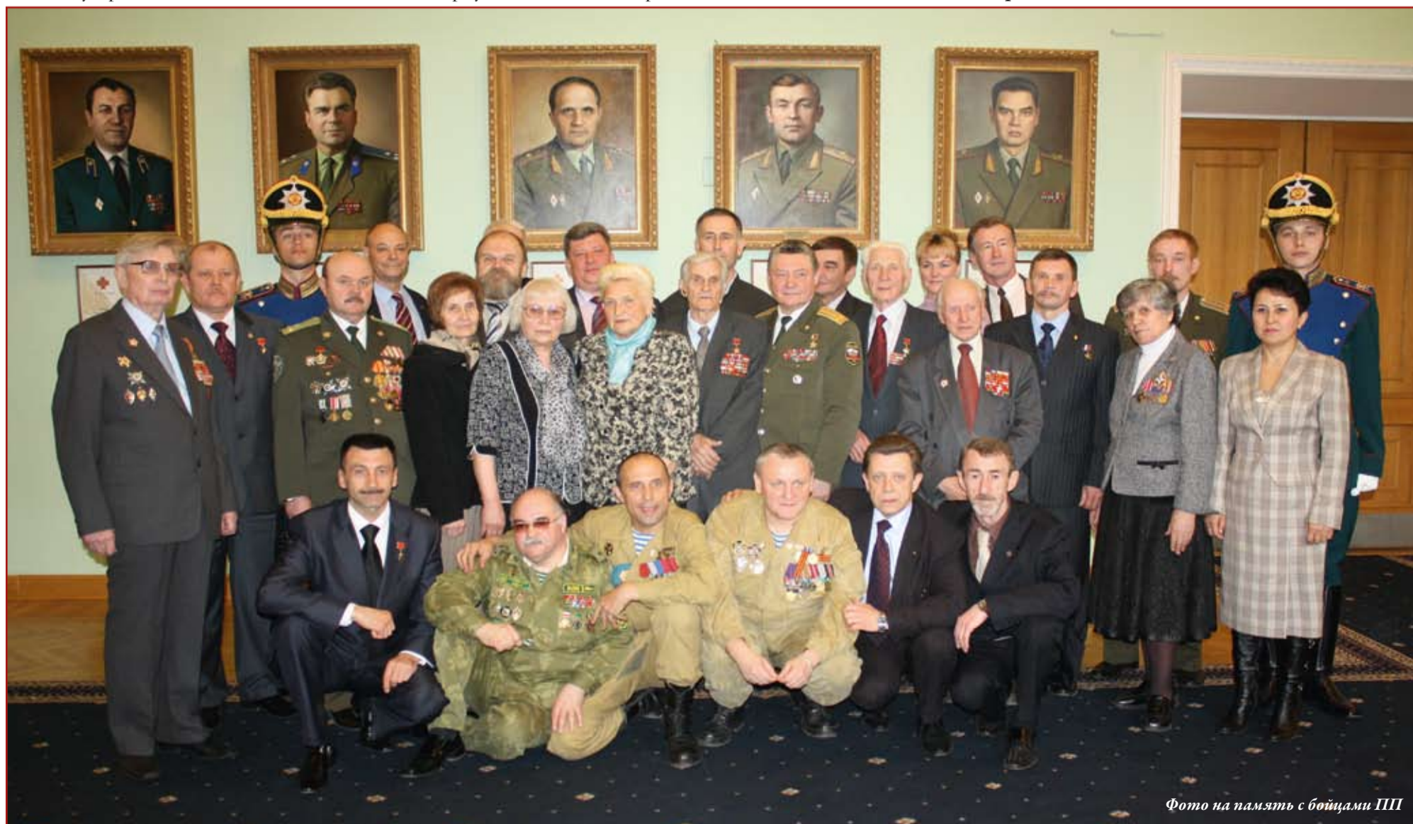
Фото на память с бойцами ПШ