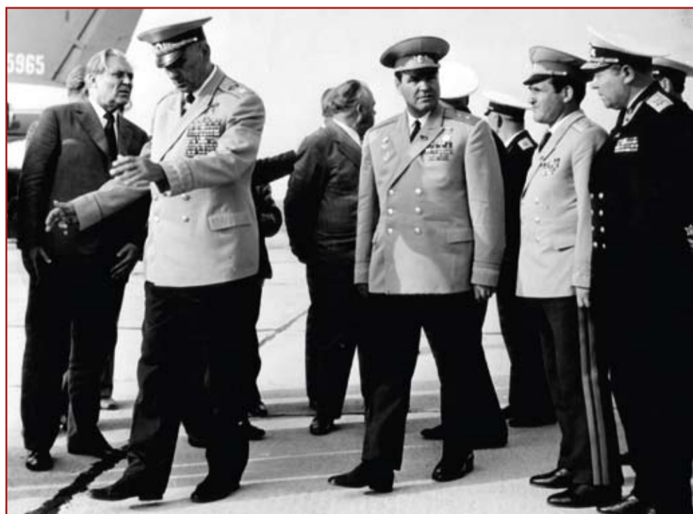
1975 год. Встреча на аэродроме 17 ВА - Багерovo. А.А.Гречко - маршал Советского Союза, Министр обороны СССР, дважды Герой Советского Союза. Крайний слева - секретарь ЦК Компартии Украины В.В.Щербицкий