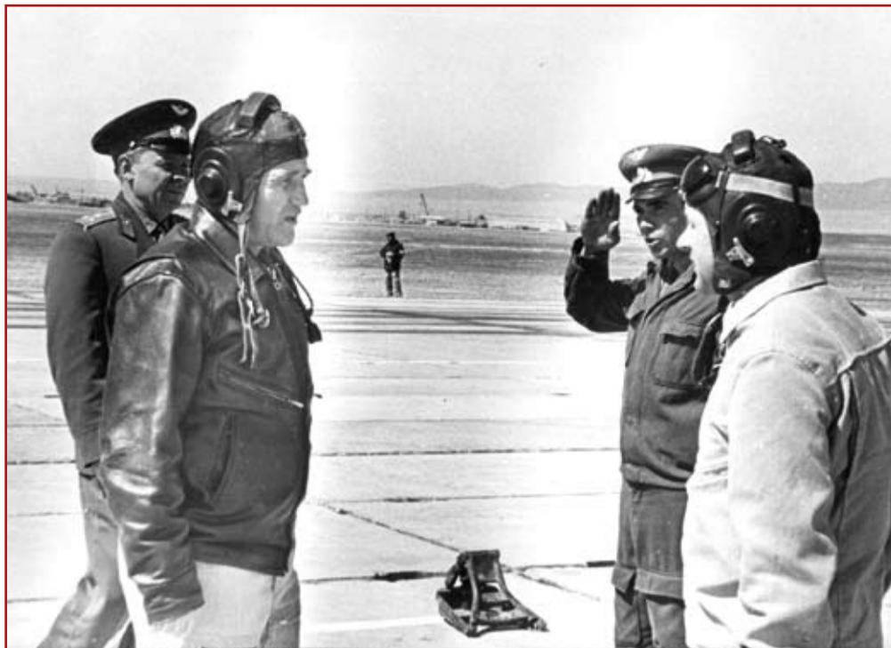
Перед полетом на сверхзвуковом самолете (МиГ-21). Аэродром Борисполь 1978 год.

и Таманского полуострова приступил к подготовке форсирования Керченского пролива и последующим боям за Крым.