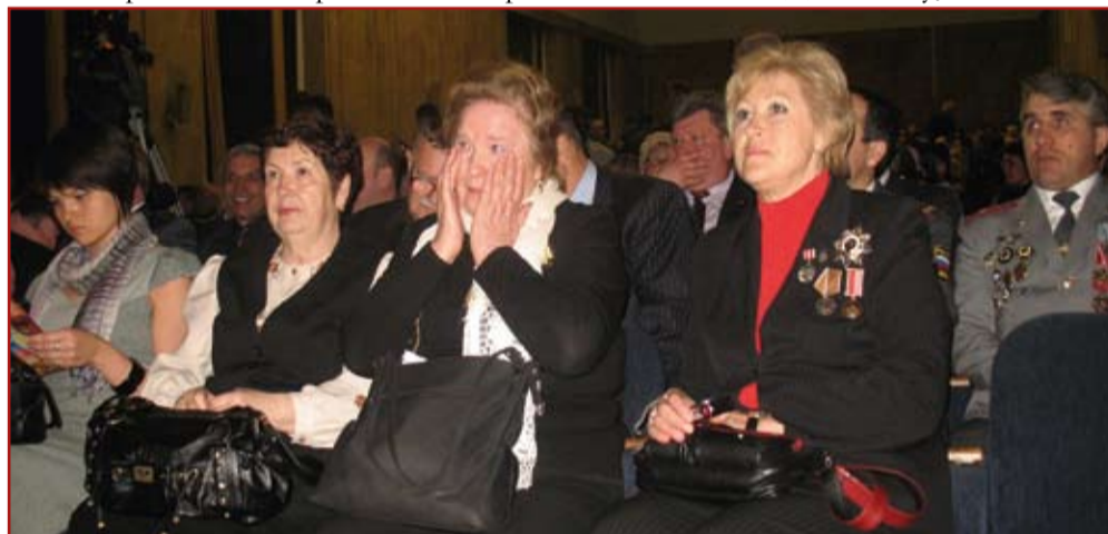
Звучит песня - «Только мама»

Для чего все это здесь говорить и печатается? Да потому, что тот же