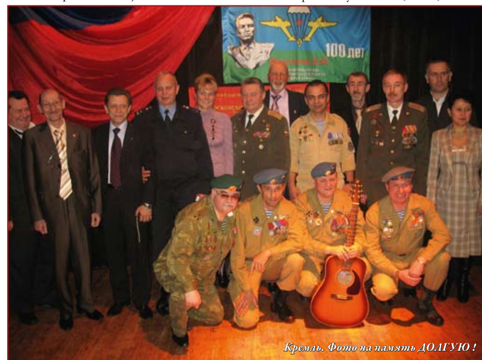
Кремль. Фото на память ДОЛГУЮ!

А сегодня, хочется поделиться личным впечатлением о проведенном 65-ом Уроке мужества, который состоялся 24 апреля 2010 года. Ровно в полдень зазвенели колокола Соборной площади Кремля. Сотни москвичей и гостей столицы собрались на второй (а первый был 17 апреля 2010 г.) конно-полковой