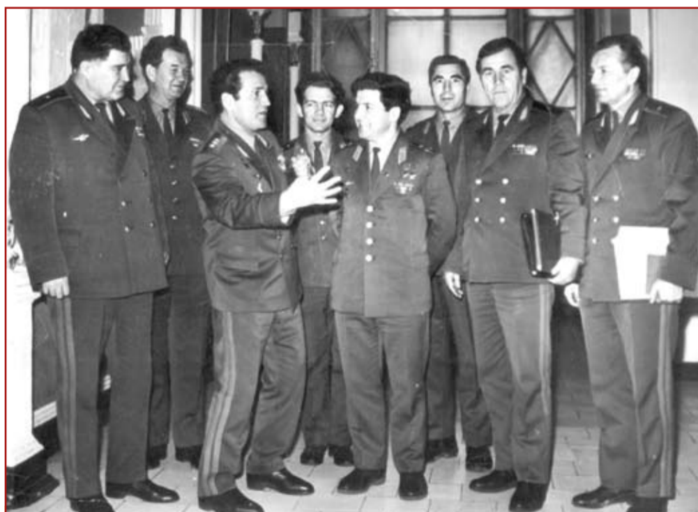
1977 год. г.Киев. Встреча с командованием 17 ВА. В центре - дважды Герой Советского Союза летчик - космонавт полковник П.И.Климух

Для успешного решения этой задачи требовалось тщательное изучение месторасположения войск противни-