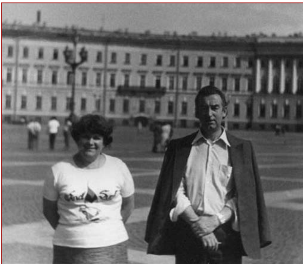
Родители Героя - Николай Осипович Чернышев и Римма Борисовна.

подразделения прибыли на место пожара через 6 минут после вызова, в тот момент огонь уже распространился по всем этажам. Позже были зафиксированы обрушения на площади в 500 квадратных метров. Пожару, который тушили почти пять часов полторы сотни брандмейстеров, был присвоен повышенный ранг сложности. Успешная эвакуация людей проводилась в сложных условиях открытого горения и сильного задымления. То, что ни один из пяти сотрудников здания не погиб, – заслуга полковника Чернышева, который лично руководил спасением людей. Начальник службы пожаротушения столичного управления МЧС России, он никогда не отсиживался во время пожаров в машине, руководя действиями подчинен-